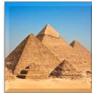
Piramida di Mesir