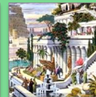
Taman gantung di Babylonia