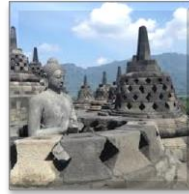
Candi Borobudur di Indonesia