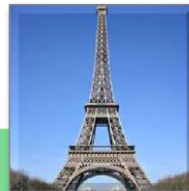
Menara Eiffel di Paris