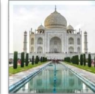
Taj Mahal di India