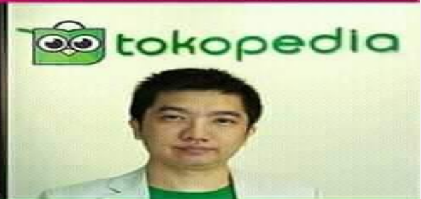
tokopedia William Tanuwijaya