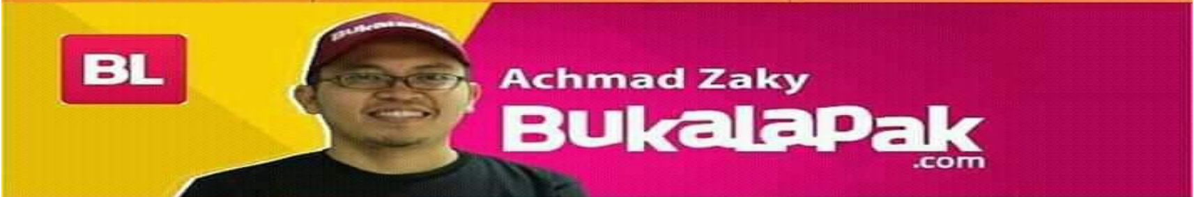
BL Achmad Zaky Bukalapak.com